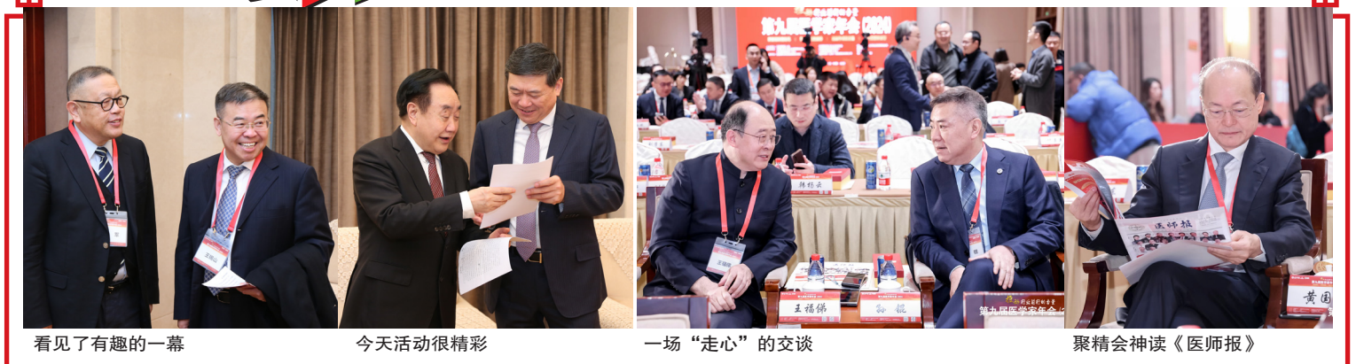
看见了有趣的一幕