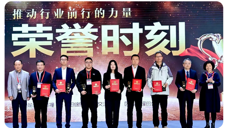
十大医学人文医院/科室：上海交通大学医学院附属新华医院、中国中医科学院广安门医院、长治市人民医院、吉林大学白求恩第三医院（中日联谊医院）、成都市第五人民医院、河北医科大学第三医院、宜宾市第二人民医院、贵州中医药大学第一附属医院麻醉科、航天中心医院、厦门市第五医院