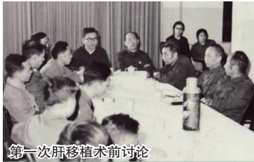
第一次肝移植术前讨论