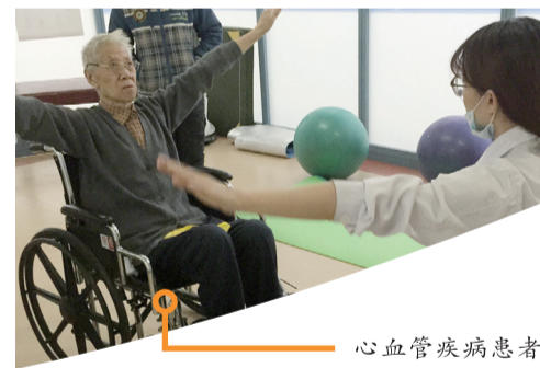
心血管疾病患者运动康复治疗中