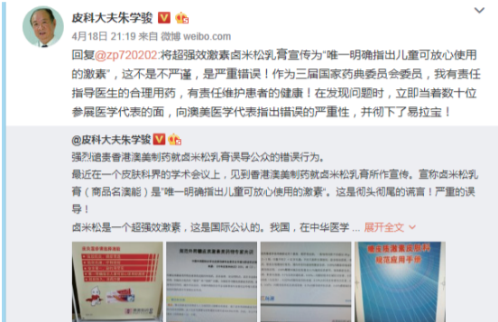
朱学骏教授该条微博阅读量超过370多万人次

谢红付教授最后强调，应加强对激素类药物规范化使用的科普宣传，“要引导民众既不怕激素，也不滥用激素的观念。”