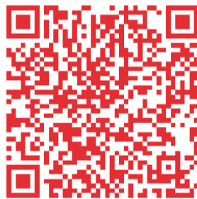
扫一扫 查阅医师报报道